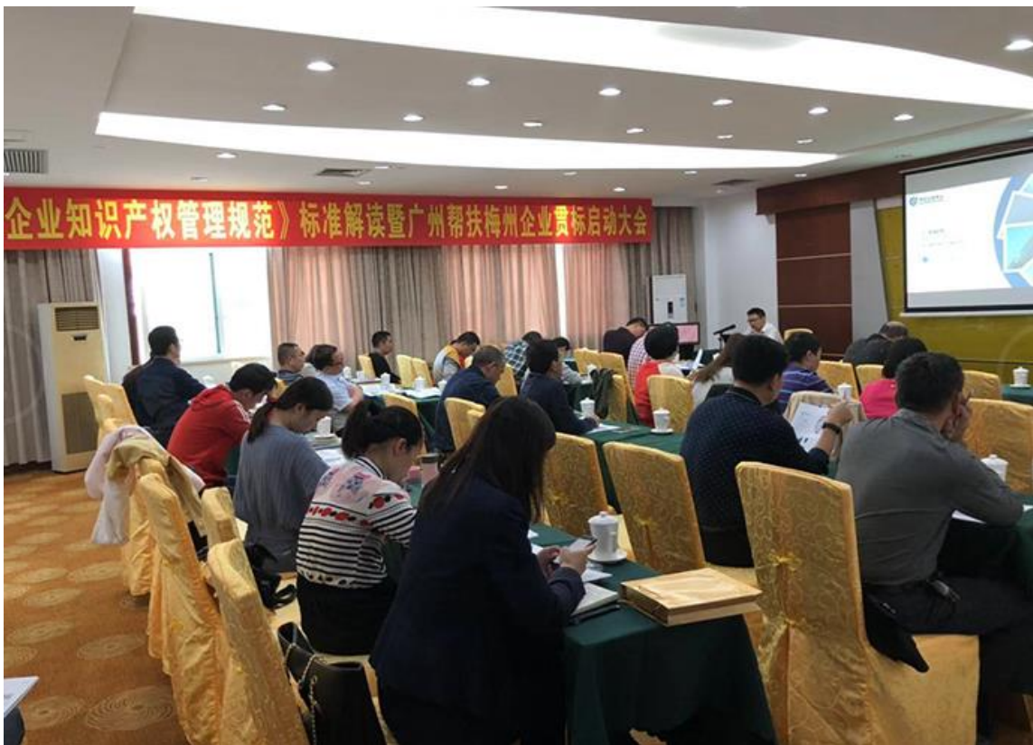
《企业知识产权管理规范》标准解读暨广州帮扶梅州企业贯标启动大会

2019年11月14日《企业知识产权管理规范》标准解读暨广州帮扶梅州企业贯标启动大会，2019年12月6日重庆市巫山县知识产权贯标宣传会，用第三方认证的手段，向社会传递信任与爱心，帮助当地政府部门全力倡导通过知识产权带动企业开拓创新，提高企业的核心竞争力，从而带动当地经济可持续发展为消除贫困尽一份力。