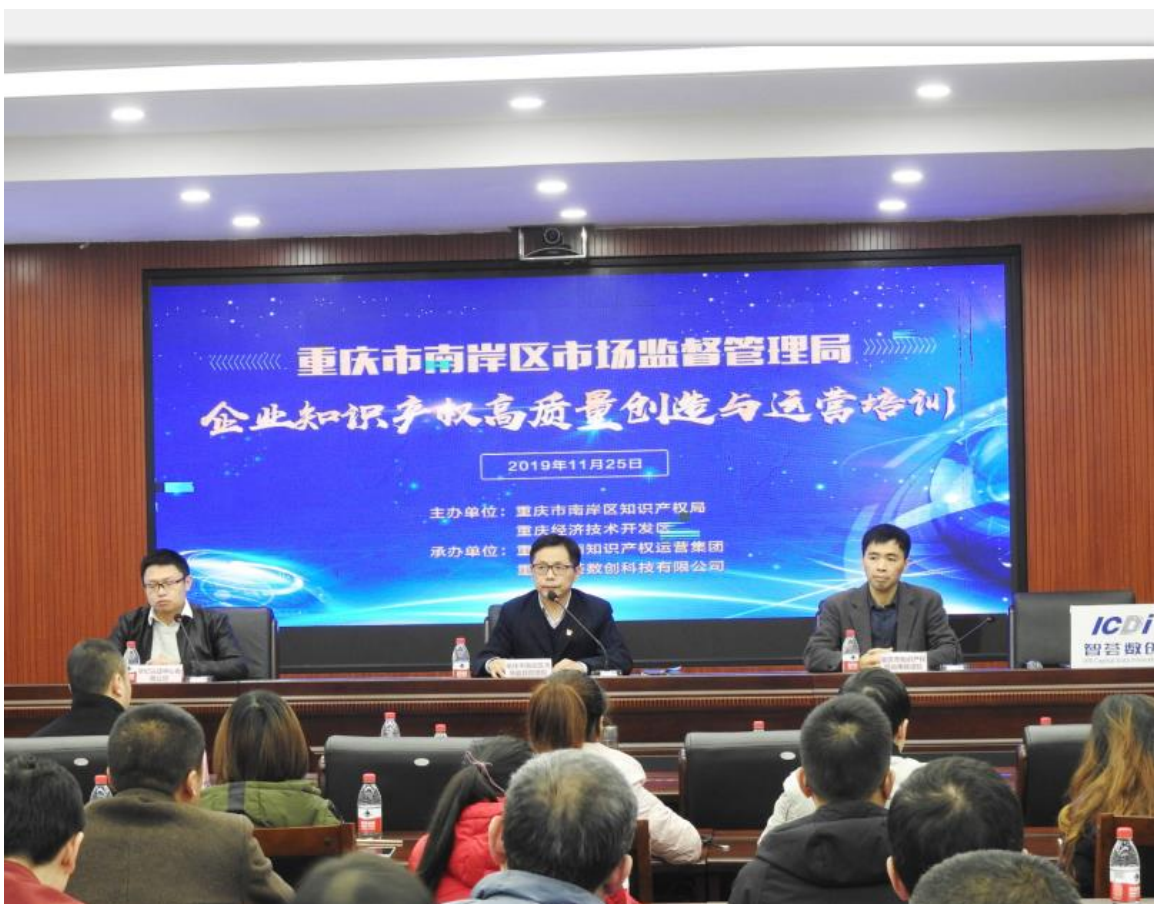
重庆市南岸区市场监督管理局企业知识产权高质量创造与运营培训会

华亿拥有一支学习能力强、专业素质高、认证经验丰富的审核团队，公司核心骨干于2019年11月25日重庆市南岸区市场监督管理局企业知识产权高质量创造与运营培训会，对在场100余家企业进行了标准解读。并且，他们在企业现场通过规范、客观、专业的认证服务工作帮助企业发现薄弱环节，并将先进管理理念和管理工具介绍给客户，帮忙客户逐步提升管理的规范性和有效性。此外，华亿利用其门户网站及公众号不定期发布行业相关政策，并进行相关专业知识的普及宣传，为提高社会相关方对认证领域的认知起到了积极推动作用。