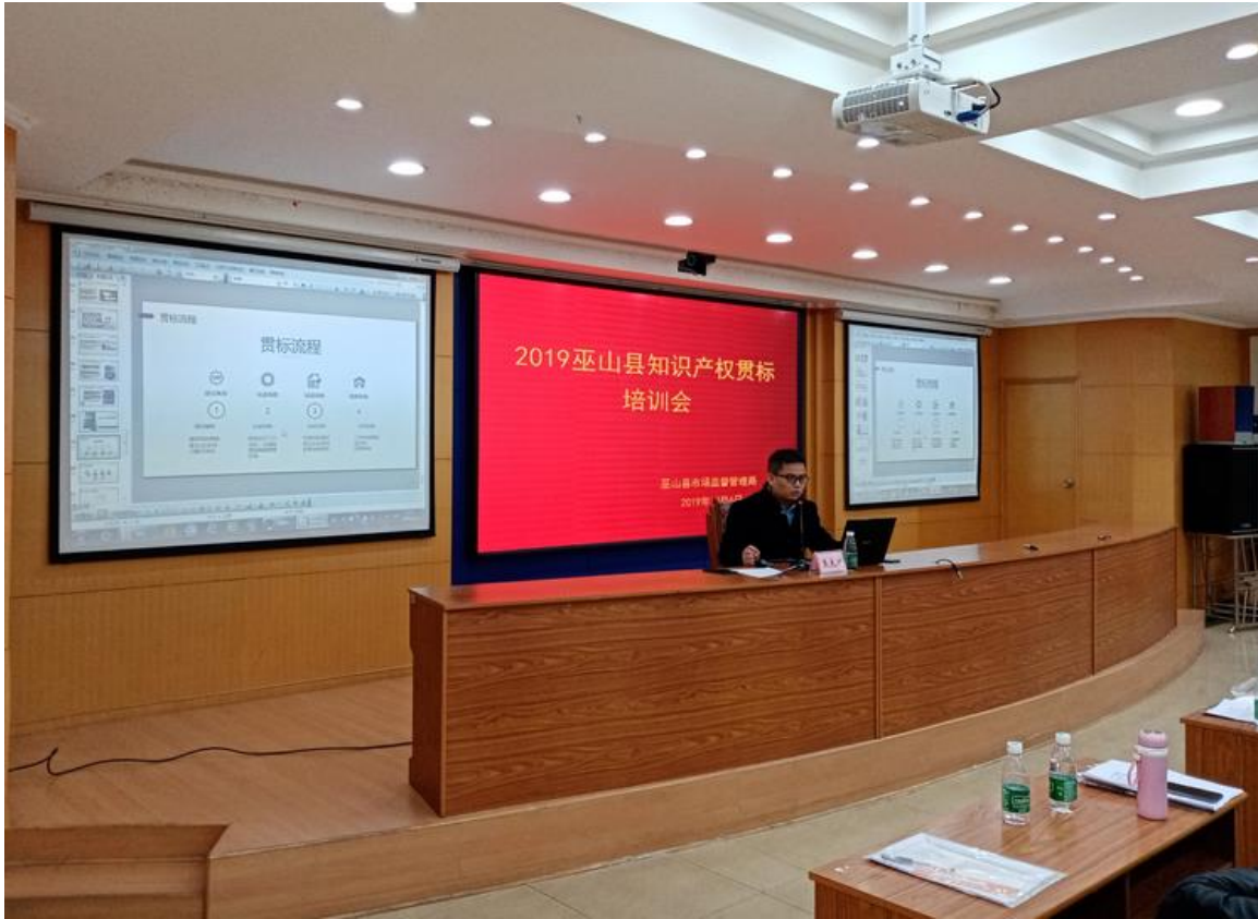
重庆市巫山县知识产权贯标宣传会