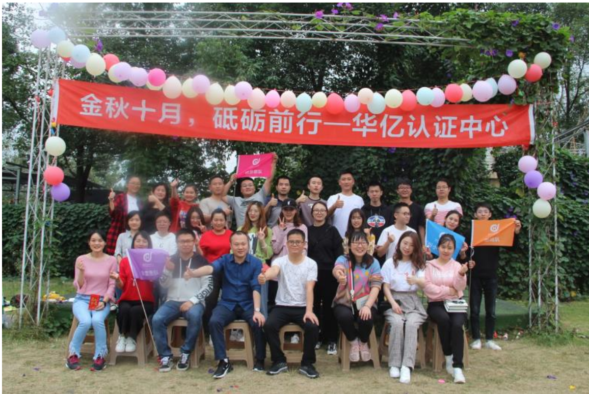
2019 年 10 月公司团建

2019 年是华亿创立的第二年，在技术序列、市场序列、管理序列全面布局，人才梯队及队伍建设工作全面提速。近两年华亿在市场团队建设上投入了大量的资源，大力补进、培养市场团队人员，提升机构技术市场开发能力；技术序列加大了优秀审核员的引进力度，改进审核员管理工作，完善审核员分级管理制度，推出线上线下培训、审核员团队带教、管理改进的新措施；管理序列强化绩效管理，加快后备干部队伍建设，建立完善能者上庸者下的管理制度。全面打造华亿带教系统，提升自我造血能力，强化机构人力资源整体竞争力方面的各项举措取得初步成效。为增强团队凝聚力，公司开展了团建、年会聚餐等活动，在工作之余以轻松的方式促进同事之间的交流，增进感情，提高工作效率。